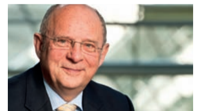
Hans-Werner Schwarz MdL

Hans-Werner Schwarz MdL Landtagsvizepräsident