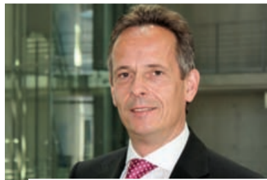
Dr. Lutz Knopek MdB