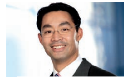
Dr. Philipp Rösler

Dr. Philipp Rösler Bundesminister für Gesundheit