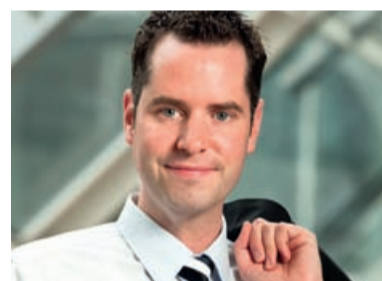
Christian Dürr MdL

Wir sollten darüber nachdenken, das Mediationsverfahren stärker zu nutzen. Eine konstruktive Schlichtung bringt mehr als Erörterungstermine, bei denen lediglich schon bekannte Informationen ausgetauscht werden.