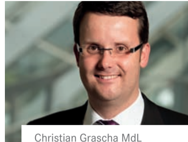
Christian Grascha MdL

■ Das Gebäude der Bundespolizei in Bad Bergzabern: Minus 43%. Die Bundesforschungsanstalt für Ernährung und Lebensmittel in Kiel: Minus 42%. Ein Pool aus Bundesliegenschaften in Hamburg: Minus 37%.