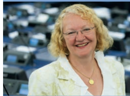
Gesine Meißner MdEP