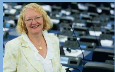
Für die FDP in Brüssel: Gesine Meißner MdEP

Die Veranstaltung zeigte deutlich, dass die Beitrittsbemühungen in der Türkei bereits viele Veränderungen bewirkt haben. Gleichzeitig besteht aber weiterhin Handlungsbedarf und die