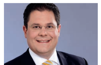
Patrick Döring MdB

Der Euro-Schutzschirm muss befristet bleiben. Als dauerhafte Einrichtung würde er das Risiko der Anleger und Spekulanten auf den Steuerzahler abwälzen und die EU zu einer Transfer-Union mit einem Länderfinanzausgleich machen. Zudem muss ein geordnetes Insolvenzverfahren für Staaten entwickelt und mit Stress-Tests für Banken kombiniert werden, um Stabilitätsrisiken im Bankensektor frühzeitig erkennen zu können. Auf die Europäische Union und die Bundesregierung wartet in den kommenden Wochen, Monaten und Jahren eine riesige Aufgabe. Oberstes Ziel der FDP in der christlich-liberalen Koalition müssen stabile Haushalte und gesundes Wachstum ohne starke Inflation in der EU sein. Wir müssen aber auch selbst mit gutem Beispiel vorangehen: Die Konsolidierung des Bundeshaushalts und eine gute Ordnungspolitik für nachhaltiges Wirtschaftswachstum müssen zum Kernprojekt unserer Regierung werden. ■