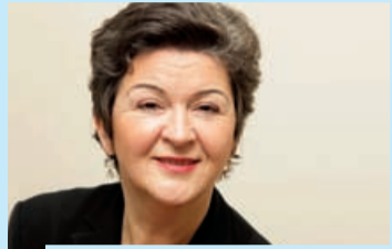
Dr. C. Ratjen-Damerau MdB