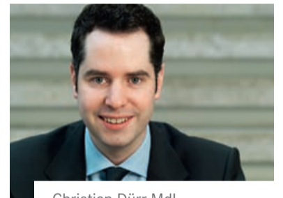
Christian Dürr Mdl.

Im Herbst soll über die Zukunft des Vertrages entschieden werden. Dürr plädiert dafür, seriösen privaten Betreibern Konzessionen zu erteilen. Für den FDP-Fraktionschef